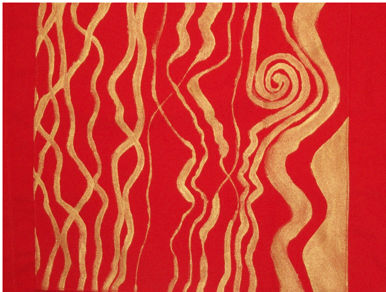
Afbeelding: Gouden levenslijnen (Folly Hemrica, Den Haag)