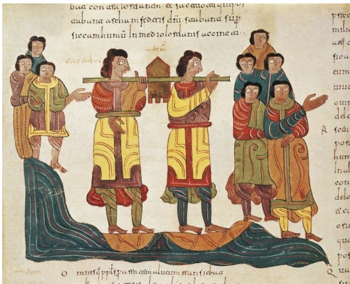
1 Koningen 8:1-14 Salomo brengt de ark des verbonds naar de tempel. Fragment uit de Mozarabische bijbel, 10e eeuw, Leon, Spanje (zie toelichting op de laatste bladzijde)